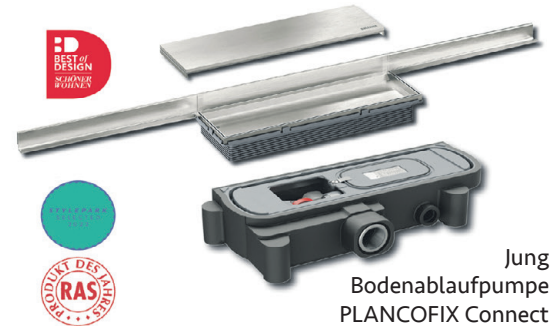
Jung Bodenablaufpumpe PLANCOFIX Connect

Der PLANCOFIX pumpt das Duschwasser hoch in die vorhandene Abwasserleitung